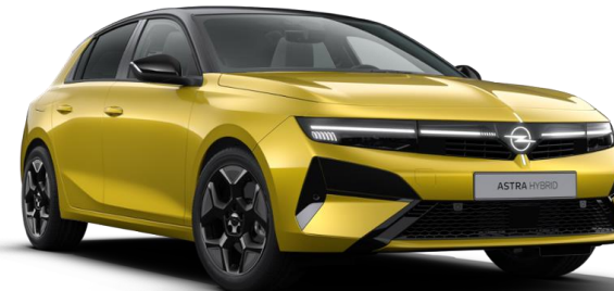
Jaune Kult métallisé