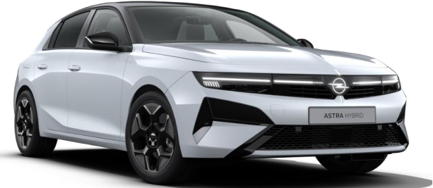
Blanc Kontour métallisé