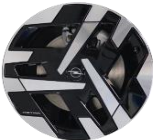
Jantes alliage 18" Falcon - Diamanté