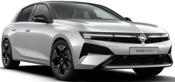
Gris Kristall métallisé