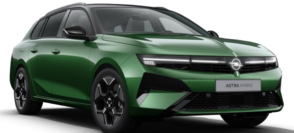
Vert Klover métallisé