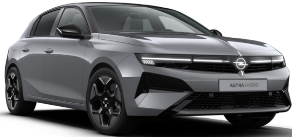
Gris Grafik opaque