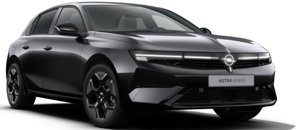
Noir Karbon métallisé