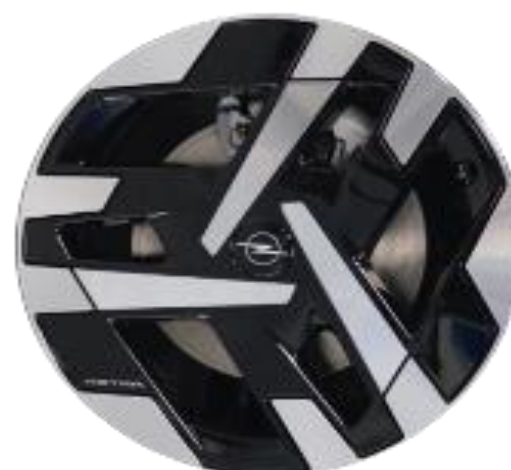
Jantes alliage 18" Falcon - Diamanté Avec Pneus Toutes saisons