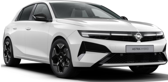
Blanc Arktis opaque