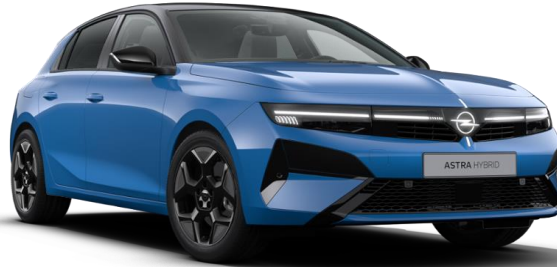
Bleu Athletiko métallisé